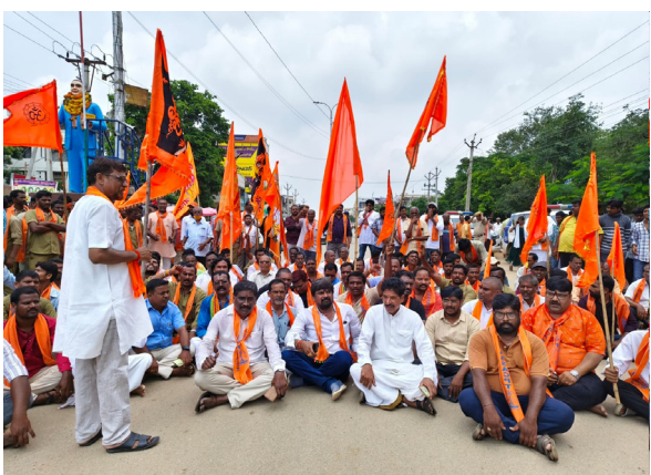
తెలంగాణ కెరటం నాగర్ కర్నూల్ జిల్లా ప్రతినిధి (ఆగస్టు 17): బంగ్లాదేశ్ లో హిందువులపై జరుగుతున్న దాడులకు నిరసనగా నాగర్ కర్నూల్ జిల్లా అచ్చంపేటలో శనివారం హిందూ సంఘాల బహిష్కారంలో పట్టణ బంద్ విజయవంతంగా

బంగ్లాదేశ్ లో హిందువులపై జరుగుతున్న దాడులకు నిరసనగా హిందూ సంఘాలు చేపట్టిన బంద్ ఆచటంపేటలో విజయవంతం.