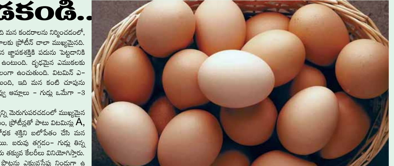
చేర్చుకోవాలి.. రోజూ ఒక గుడ్డు తినడం ఆరోగ్యానికి చాలా మంచిదని వైద్య నిపుణులు చెబుతున్నారు. అయితే.. కొన్ని సమస్యలు ఉన్నవారు వైద్యుల సలహాలు సూచనలు పాటించి తీసుకోవడం మంచిది..

ప్రోటీన్, మంచి పోషక వనరులలో గుడ్డ ఒకటి.. అందుకే.. గుడ్డు ఆరోగ్యానికి వెరీగుడ్డు అంటారు.. గుడ్డతో కూడిన అల్పాహారం చాలా ఆరోగ్యకరమైనది. గుడ్డులో ఉండే ప్రోటీన్లు, విటమిన్లు, వివిధ మినరల్స్ మన శరీరంలోని వివిధ అవయవాలను ఆరోగ్యంగా, బలంగా ఉంచుతాయి. అందువల్ల గుడ్డును చౌకగా, సులభంగా లభించే సూపర్ ఫుడ్ అంటారు. ఇవి అన్ని వయసుల వారికి మంచివి.. ఆరోగ్యాన్ని కాపాడటంలో చాలా సహాయపడతాయి.. నిపుణులు అభిప్రాయం ప్రకారం, మీరు ఫిట్ నెస్ ను కాపాడుకోవాలంటే ఆహారంలో గుడ్డు తప్పనిసరిగా చేర్చాలి. ఒక పెద్ద గుడ్డులో 6 గ్రాముల ప్రోటీన్ ఉంటుంది.. ఇది కండరాల బలానికి ఉపయోగపడుతుంది. ఇది ఆరోగ్యానికి కూడా మేలు చేస్తుంది. బరువు తగ్గలని ప్రయత్నించే వారికి కూడా గుడ్డు మేలు చేస్తాయి. విటమిన్లు - ఖనిజాలు: గుడ్డు ప్రోటీన్లు, విటమిన్లు, ఖనిజాలు, యాంటీఆక్సిడెంట్లు.. అనేక ఇతర పోషకాలతో నిండి ఉంటాయి. గుడ్డు పచ్చసొనలో చాలా ప్రోటీన్లు ఉంటాయి. ఇది చాలా పోషకాలను కలిగి ఉంటుంది.. ఇది ఆరోగ్యానికి చాలా ఉపయోగకరంగా ఉంటుంది. ప్రోటీన్