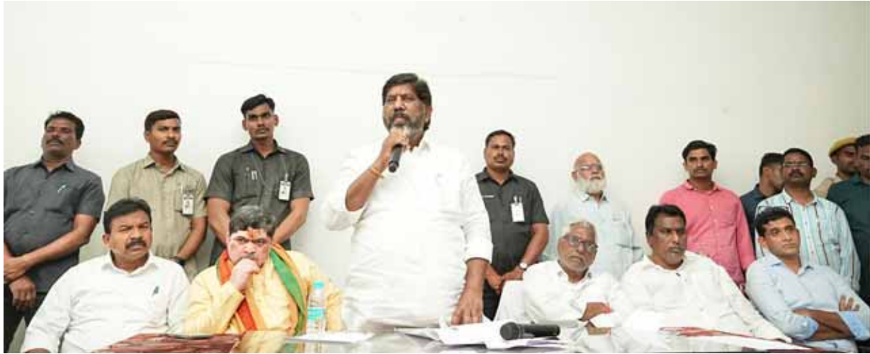
గురుకులాలను ప్రక్షాళన చేస్తాం...

PUBLISHED FROM HYDERABAD, NALGONDA, KARIMNAGAR, WARANGAL, KHAMMAM, VIJAYAWADA, VISHAKHAPATNAM, TIRUPATI