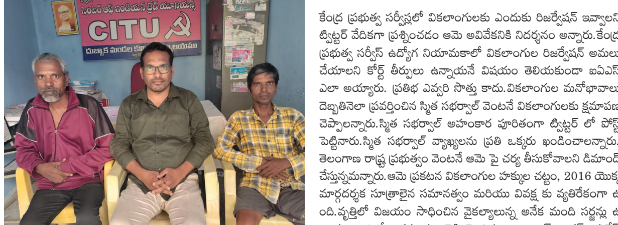
కేంద్ర ప్రభుత్వ సర్వీస్ లో వికలాంగులకు ఎందుకు రిజర్వేషన్ ఇవ్వాలని ట్యూటర్ వేదికగా