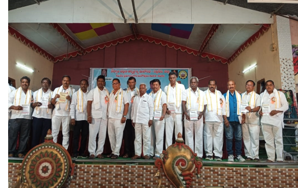
తెలంగాణ కరటం చేర్యాల ప్రతినిధి జూలై 22: చేర్యాల పట్టణంలోని స్థానిక వాసి గార్లెన్ లో సోమవారం పట్టణ ఆర్వైఆర్