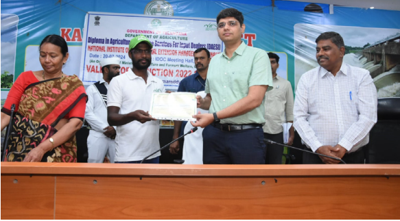
తెలంగాణ కరటం కామారెడ్డి జిల్లా ప్రతినిధి జూలై 22: అగ్ర కలెక్టర్ మేనేజింగ్ కోర్సు పూర్తి చేసిన వారికి జిల్లా కలెక్టర్ ఆశీస్