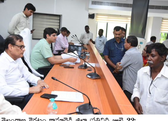
తెలంగాణ కరటం కామారెడ్డి జిల్లా ప్రతినిధి జూలై 22: కామారెడ్డి లో జరిగిన ప్రజావాణి కార్యక్రమంలో 91 ఫిర్యాదులు వచ్చినట్లు