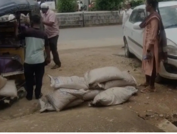
తెలంగాణ కరటం నాగర్ కర్నూల్ జిల్లా ప్రతినిధి జూలై 22: నాగర్ కర్నూలు జిల్లా అచ్చంపేట మండల పరిధిలో గల రంగాపూర్ గ్రామంలో