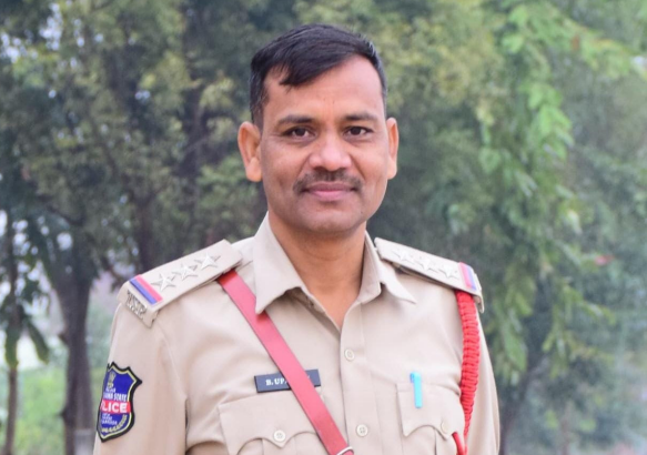
తెలంగాణ కరటం సిద్దిపేట జిల్లా క్రైమ్ ప్రతినిధి టూ టౌన్ ఇన్స్పెక్టర్ కేసు యొక్క వివరాలు తెలియపరచాడు. నేరస్తుడైన