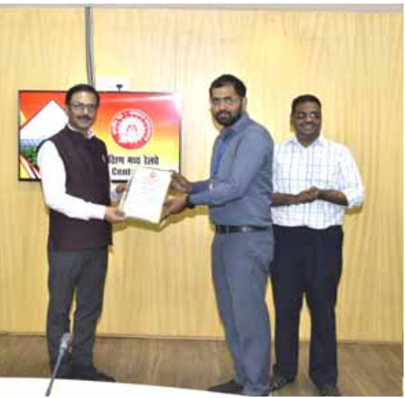
ప్రధానమంత్రి ఇవ్వాలని ఆయన పేర్కొన్నారు. జోన్ లో సీక్స్ డ్రైవలను కొనసాగించాలని, అప్రమత్తంగా ఉండేందుకు మరియు అవాంఛనీయ సంఘటనలు జరగకుండా అకస్మిక తనిఖీలు చేయాలని ఆయన ఆదేశించారు. లోకో పైలట్లు, షంట్లర్లు, ట్రాక్ మెయింటెనెన్స్, గార్డులు తదితర క్షేత్రాల్లోని సిబ్బంది అందరికీ ఎప్పటికప్పుడు భద్రత పై కొన్నెలకు నిర్వహించాలని అధికారులకు సూచించారు. జోన్ లో సరుకు రవాణా కార్యకలాపాలపై జనరల్ మేనేజర్ సవరణకానున్నారు. ఈ సమావేశానికి బీజేపీ టీఎం జనరల్ మేనేజర్ ట్రాక్ పునరుద్ధరణలకు సంబంధించి కొనసాగుతున్న పనుల పురోగతిని కూడా సమీక్షించారు.