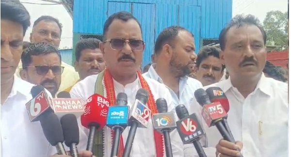
తెలంగాణ కెరటం నాగర్ కర్నూల్ జిల్లా ప్రతినిధి (మే 27):