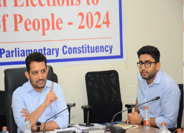
మేడ్చల్ మల్కాజ్గిరి జిల్లా, మే 27 (తెలంగాణ కెరటం) సోమవారం రోజున విసి మీటింగ్ హాల్లో మేడ్చల్, మల్కాజ్గిరి, కుత్బుల్లాపూర్, కూకట్పల్లి, ఉప్పల్, ఎల్ బి నగర్, సికింద్రాబాద్ కంటోన్మెంట్ నియోజకవర్గాల ఏ ఆర్ టోతో కౌంటింగ్ ఏర్పాటుపై సమీక్ష నిర్వహించారు. ఈ సందర్భంగా కలెక్టర్ మాట్లాడుతూ జూన్ 4న జరుగుతున్న ఓట్ల లెక్కలను ఎన్నికల సంఘం మార్గదర్శకాలకు అనుగుణంగా పగడ్పందిగా నిర్వహించాలని అన్నారు. కౌంటింగ్ కేంద్రాల పద్ధ తీసుకోవలసిన చర్యలు గుర్తించి ఏ ఆర్ టోలకు కలెక్టర్ సూచనలు చేశారు. జూన్ 4వ తేదీన ఉ దయం ఎనిమిది గంటలకు కౌంటింగ్ ప్రక్రియ మొదలు పెట్టాలన్నారు. కౌంటింగ్ కు కావలసిన టేబుల్స్ నియోజకవర్గాల వారిగా మేడ్చల్ 28, మల్కాజ్గిరి 20, కుత్బుల్లాపూర్ 28, కూకట్ పల్లి 20, ఉప్పల్ 20, ఎల్ బి నగర్ 28, సికింద్రాబాద్ కంటోన్మెంట్ 14, మరియు పోస్టల్ బ్యాలెట్ కు 20 టేబుల్స్ ఏర్పాటు చేయడం జరుగుతుందన్నారు. మేడ్చల్, మల్కాజ్గిరి,